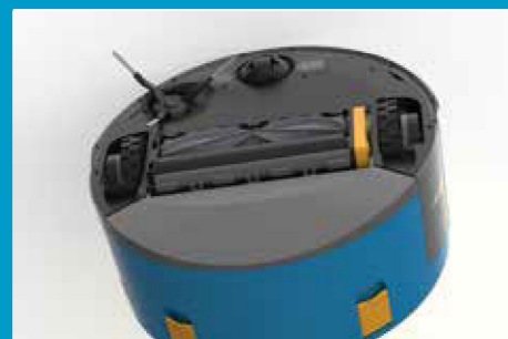
Gefederte Doppelbürste für die perfekte Reinigung auch von unebenen Böden.

Weitere Informationen zu unserem co-botic 1900 finden Sie unter: i-teamglobal.com