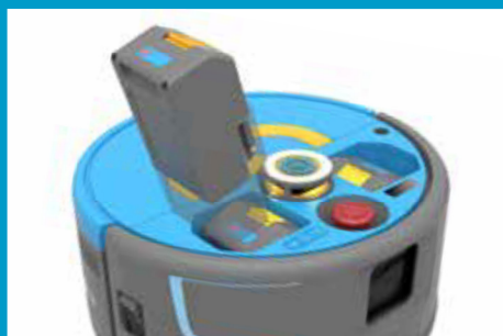
Wiederaufladbare und austauschbare Akkus.